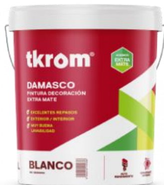
TKROM DAMASCO EXTRA MATE

Descripción del producto: Pintura plástica de acabado mate profundo, a base de un copolímero acrílico en dispersión acuosa. Especialmente formulado para el pintado de superficies lisas, a las que comunica un acabado mate sin reflejos, que evita que se noten diferencias de brillo en los repasos. Excelente dureza y resistencia al lavado.