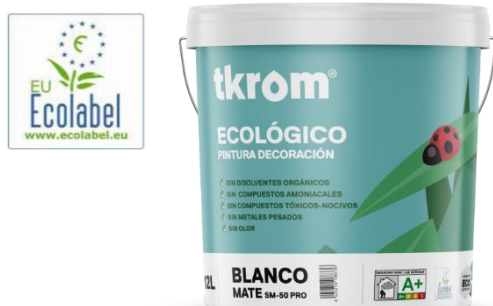
TKROM ECOLOGICO MATE SM-50

Este producto dispone de Etiqueta Ecológica de la UE con el número ES-MU/044/00001.