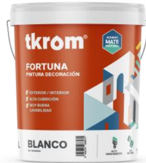
TKROM MATE FORTUNA

Descripción del producto: Pintura plástica mate a base de dispersión acuosa de copolímero vinil etilénico. Formula mejorada, minimiza la salpicadura producida por el pintado a rodillo. Excelentes propiedades de nivelación, aplicación, cubrición y lavabilidad. Bajos niveles de COV'S y libre de amoniaco.