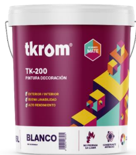
TKROM MATE TK-200

Descripción del producto: Pintura plástica mate a base de copolímeros acrílicos, de acabado mate profundo. Formula mejorada, minimiza la salpicadura producida por el pintado a rodillo. Excelente equilibrio entre aplicación, cobertura, rendimiento y lavabilidad. Idónea para uso profesional. Bajos niveles de COV'S y libre de amoníaco.