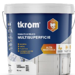
TKROM ESMALTE MULTISUPERFICIE SATINADO

Descripción del producto: Esmalte acrílico al agua multisuperficie de alta calidad, a base de emulsión acrílica pura. Decora y protege superficies tanto exteriores como interiores. Secado rápido y sin pegajosidad, permitiendo el uso en breve espacio de tiempo. Fácil de aplicar, posee un agradable aroma, excelente opacidad y rendimiento con acabados profesionales. No amarillea y conserva el brillo. Buena adherencia sobre soportes de madera, metal, plástico, cerámica y mampostería. Con nueva tecnología que proporciona las más altas prestaciones de lavabilidad, resistencia y durabilidad. Bajo contenido en compuestos volátiles (COVs). Con conservante antimoho.